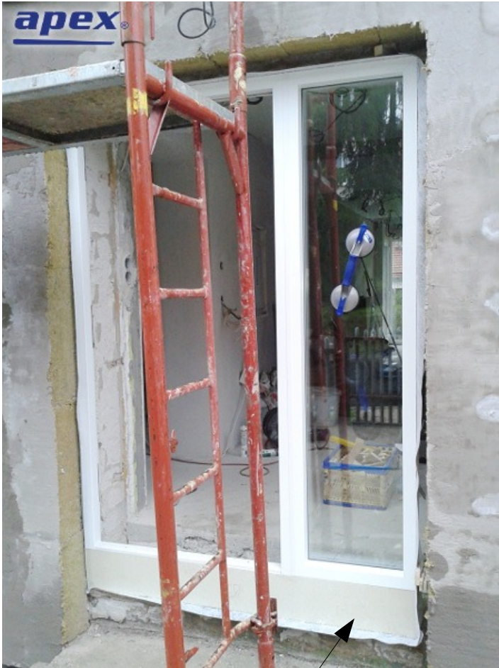
Pohľad z von. Purenit.