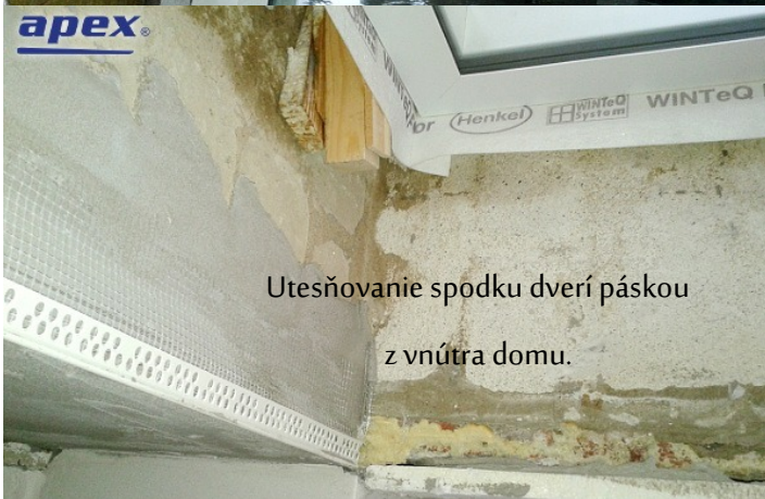
Utesňovanie spodku dverí páskou z vnútra domu.