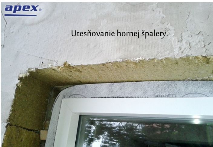
Utesňovanie hornej špalety.