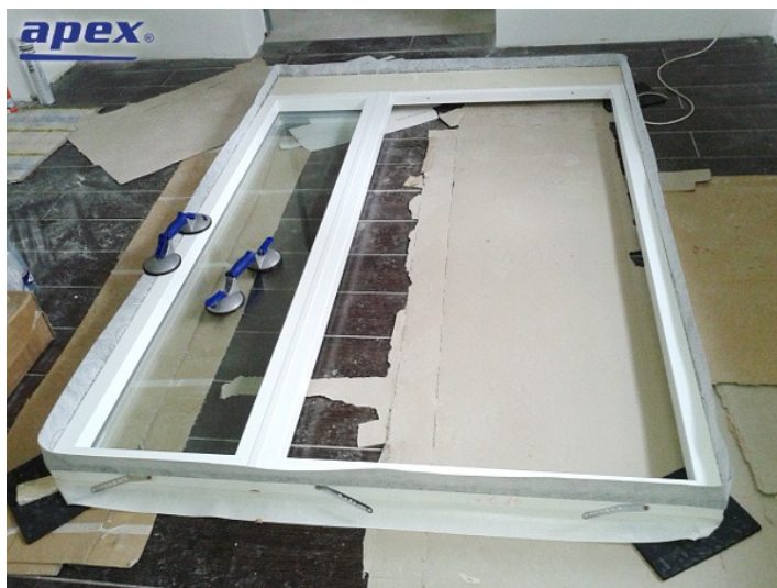
Opáskovanie zárubne paropriepustnou a paronepriepustnou páskou