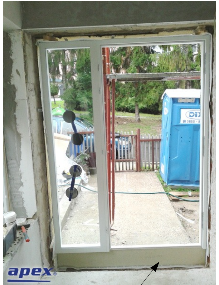
Pohľad z dnu. Purenit.