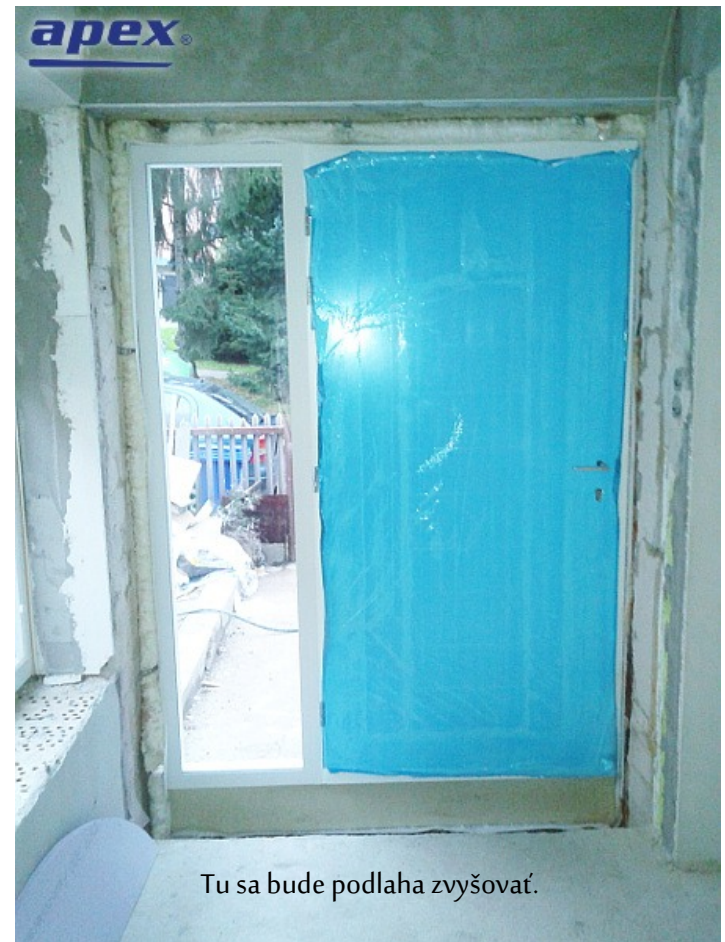
Tu sa bude podlaha zvyšovať.